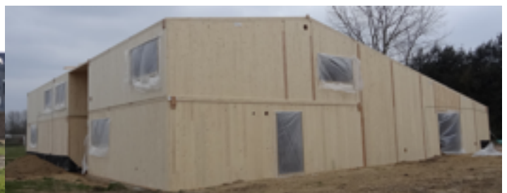
zaterdag 14 maart 2015