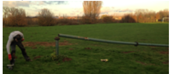
zaterdag 6 december 2014