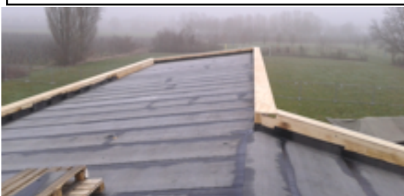
woensdag 18 maart 2015

Bouwkrantje, Tijdschriftje van Bouwcomité KSA Zwijndrecht en vzw Vlaamse Kerels, jaargang 3, nr. 2 (april 2015) Redactie: Hans Van Nespren, Koen De Decker Affiche: Julie Van Reeth