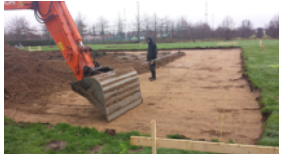
maandag 26 januari 2015