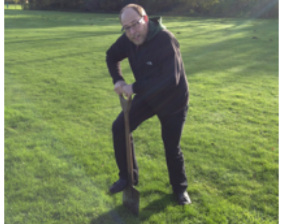
zondag 9 november 2014

U kan de werkzaamheden volgen op lokalen.ksazwijndrecht.be of via facebook op de pagina KSA Zwijndrecht bouwt.