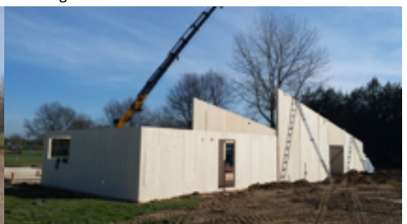
woensdag 11 maart 2015