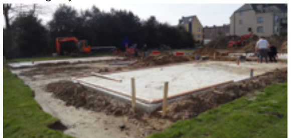
zaterdag 7 maart 2015