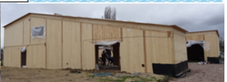
zaterdag 21 maart 2015