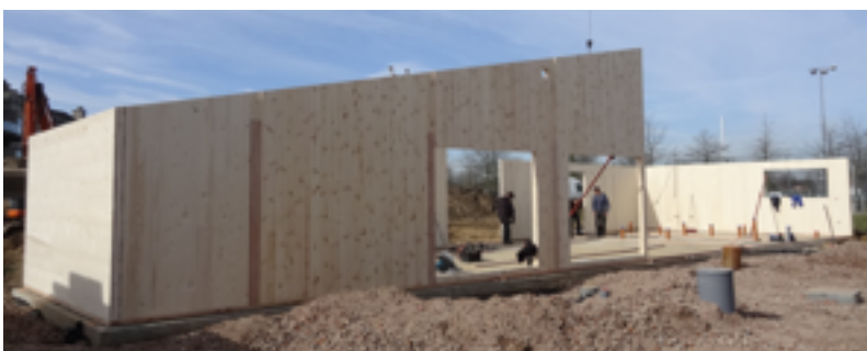
woensdag 11 maart 2015