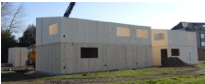
donderdag 12 maart 2015

za 11 april werkdag za 18 april werkdag za 25 april werkdag za 2 mei werkdag za 9 mei werkdag za 23 mei kijkmoment za 19 sept. meiboom za 31 okt. muntentapijt feesten '16 opening