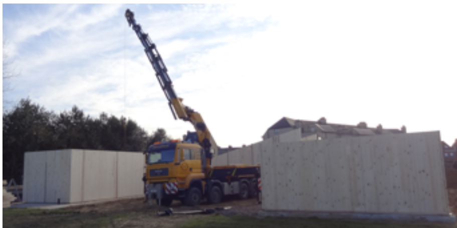
woensdag 11 maart 2015

In de hoop dat u ons wil helpen om het laatste gaatje dicht te rijden, nodigen wij u alvast uit op de meiboomplanting van 19 september 2015. Tevens organiseren wij op zaterdag 23 mei e.k. een kijkmoment in het