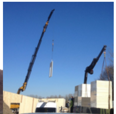
donderdag 12 maart 2015